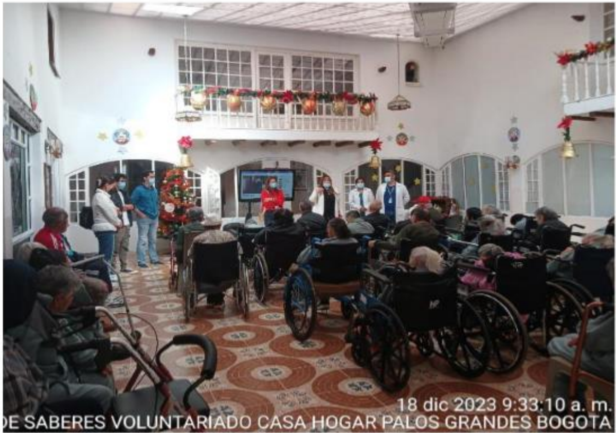
18 dic 2023 9:33:10 a. m. DE SABERES VOLUNTARIADO CASA HOGAR PALOS GRANDES BOGOTA