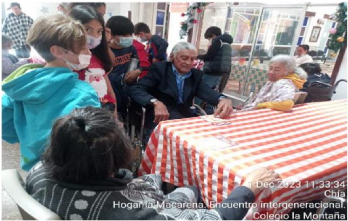
1 Dec 2023 11:33:34 Chía Hogar la Macarena. Encuentro intergeneracional. Colegio la Montaña